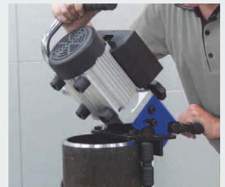
· Entgraten von Rohren möglich