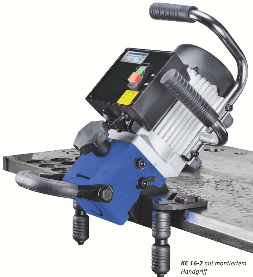
KE 16-2 mit montiertem Handgriff