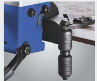
· stufenlose Winkeleinstellung von 0°-60° · mit zwei Walzen für leichteren Vorschub