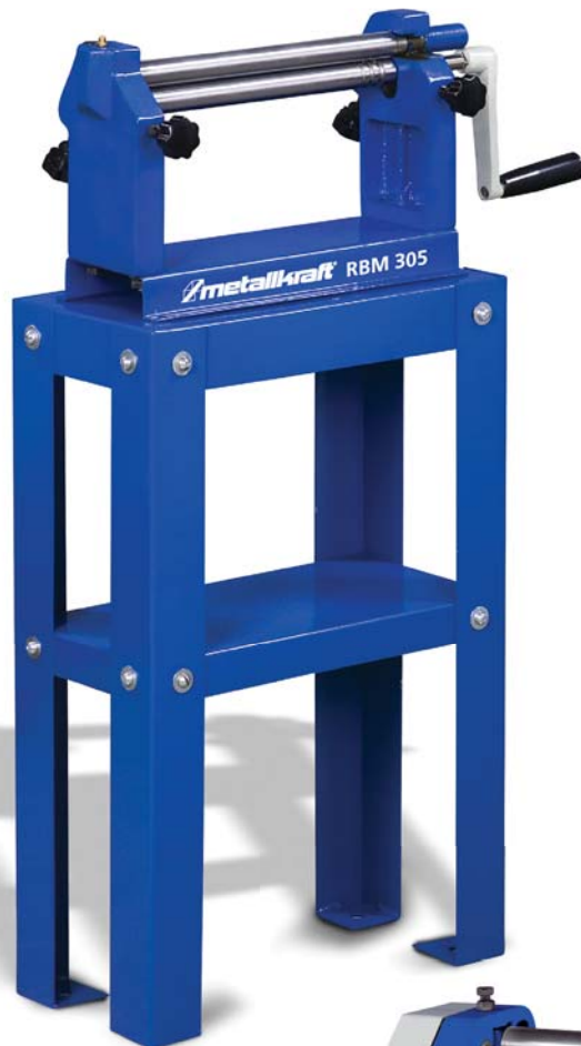
RBM 305 mit optionalem Unterbau (Art.-Nr. 3780113)