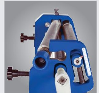
▶ Die obere Walze ist ausstellbar, dadurch einfache Entnahme des fertigen Werkstücks