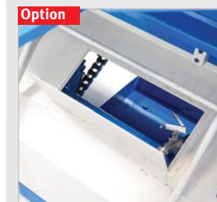
Kleinteileklappe für Auswurf nach vorne