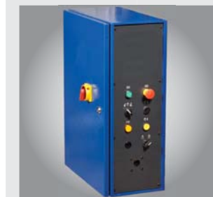
▶ Übersichtliche Steuerung