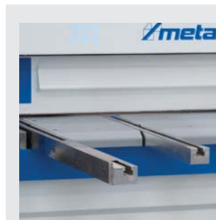
▶ Arbeitstisch mit massiven Auflagearmen