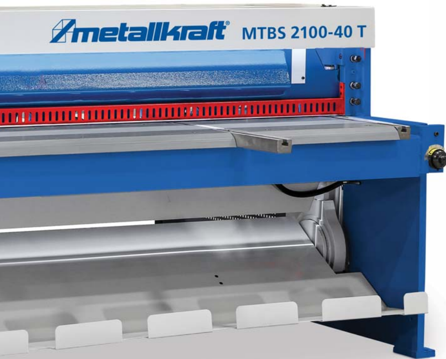
MTBS 2100-40 T